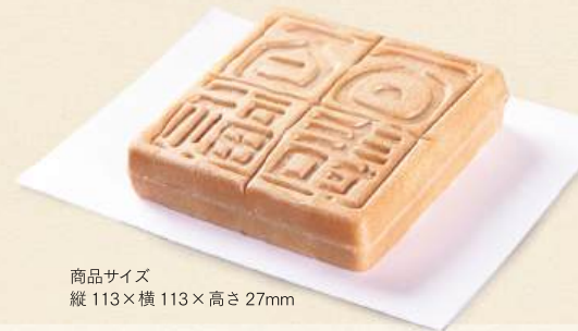
商品サイズ 縦 113×横 113×高さ 27mm