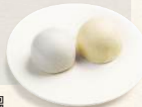
商品サイズ 直径 135mm 高さ 24mm

黄の中はこし餡、白の中は白餡とつぶ餡の二重餡。 ※入り数等は紅白薯蕷饅頭と同様ラインナップ・価格になります