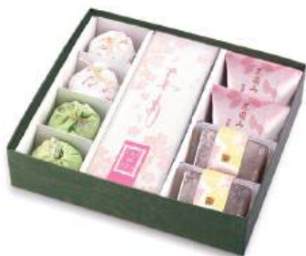
KH-37S 季寄せ 3,996円(3,700円)