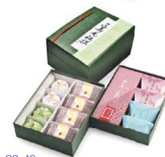
GS-48 雅撰二段 5,195円(4,810円)

上段 / 關伽井(黒蜜きなこ・抹茶)各4個 中段 / あも1本、花遊山4個 下段 / 一壺天2個、野づつみ2個、栗山家4個