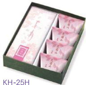
KH-25H あも(桜)・花遊山詰合せ 2,744円(2,540円)