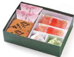
KH-20A 季寄せ 2,214円(2,050円)