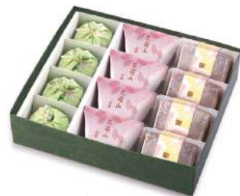
KH-34 季寄せ 3,694円(3,420円)