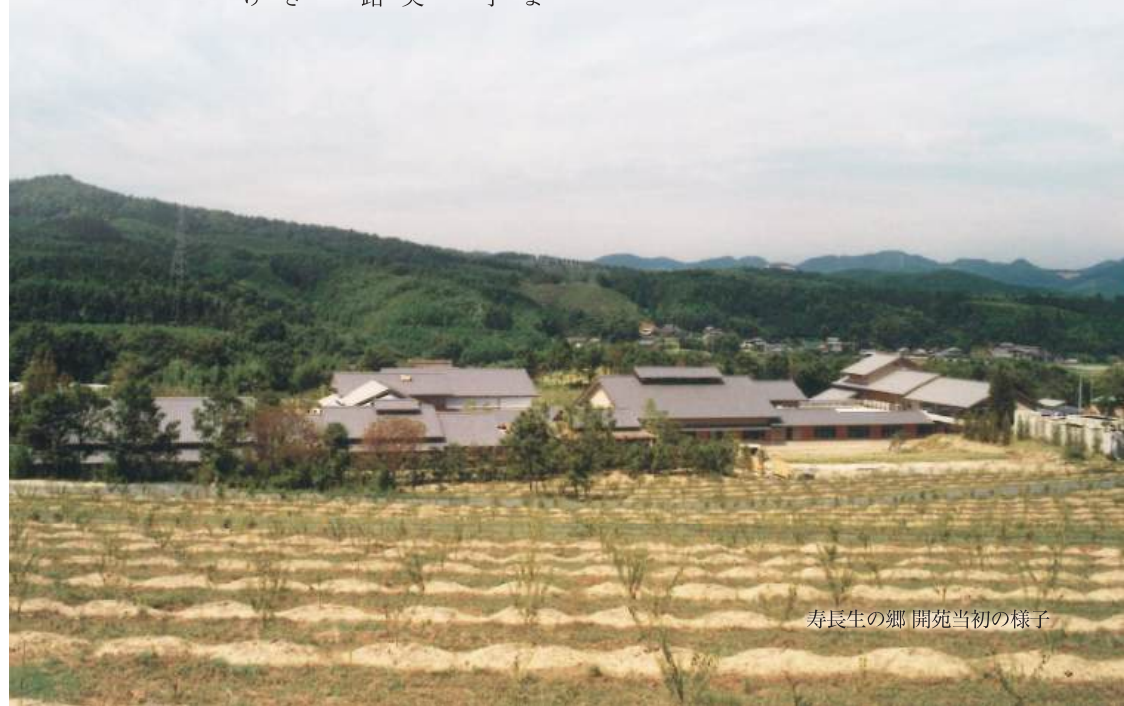
寿長生の郷 開苑当初の様子