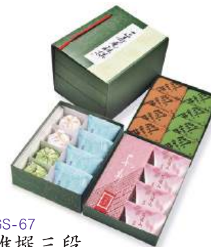
GS-67 雅撰三段 7,247円(6,710円)

上段 / 關伽井(黒蜜きなこ・抹茶)各4個 中段 / あも1本、花遊山4個 下段 / 一壺天2個、野づつみ2個、栗山家4個