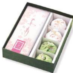
KH-25M 季寄せ 2,765円(2,560円)