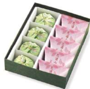
野づつみ・花遊山詰合せ 2,744円(2,540円)